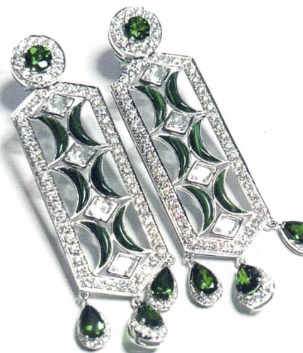
Ohrschmuck „Lion Earrings“