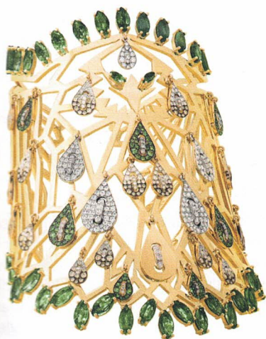
Armspange aus der Kollektion „Shades of Date“.