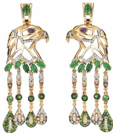
Ohrschmuck aus der Kollektion „Shades of Date“.