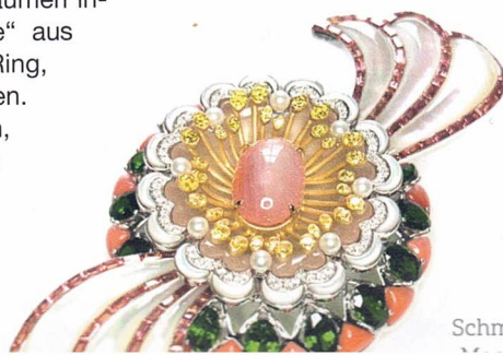
Schmuckstück „Moon Fairy & Rose“