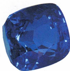
Der unbehandelte königsblaue Saphir aus dem Anhänger des Colliers.

Durch die Zusammenarbeit von Elke Berr Créations und Berr & Partners ist das mit über 50 Carat diamantenbesetzte Weissgold-Collier „Tella“ entstanden. Der abnehmbare Anhänger ist mit einem unerhitzten königsblauen Saphir bestückt. Mit mehr als 45 Carat ist der Saphir eines der grössten Exemplare, die jemals in der inzwischen erschöpften historischen Elahera-Mine in Sri Lanka gefunden wurden. Das Collier soll die Synergie der beiden Marken symbolisieren, die Handwerkskunst von Elke Berr Créations und die Edelsteinexpertise von Berr & Partners.